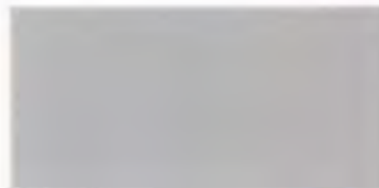
C-19 グレー [透光率 0.2%]