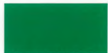
U-09 フォレストグリーン [透光率 0.1%]