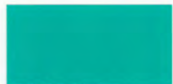
U-08 スカイグリーン [透光率 0.6%]