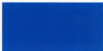
C-01 ロイヤルブルー [透光率 0.0%]