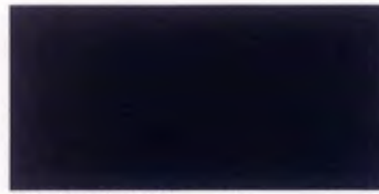
U-20 ブラック [透光率 0.0%]