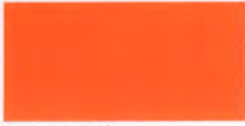
U-12 オレンジ [透光率 2.6%]