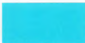
U-03 アクアブルー [透光率 3.9%]