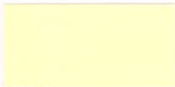
U-31 クリーム [透光率 12.5%]