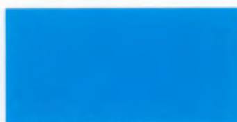
U-02 ライトブルー [透光率 0.8%]