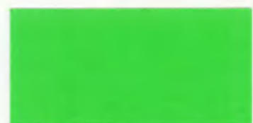
U-10 ライトグリーン [透光率 2.1%]