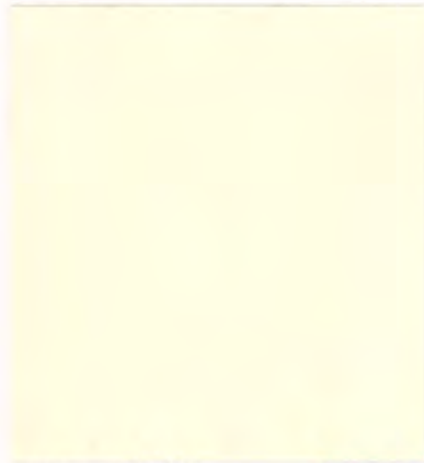
U-17 アイボリー [透光率 10.4%]