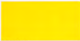
U-11 イエロー [透光率 9.4%]