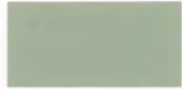
U-26 ワサビ [透光率 0.2%]