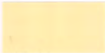
U-16 ベージュ [透光率 7.4%]