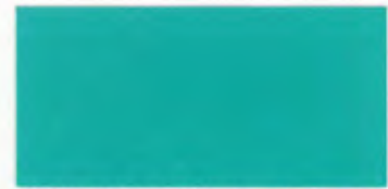
U-04 エメラルドグリーン [透光率 0.5%]