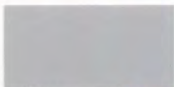
U-19 グレー [透光率 1.2%]