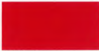
U-13 レッド [透光率 0.7%]