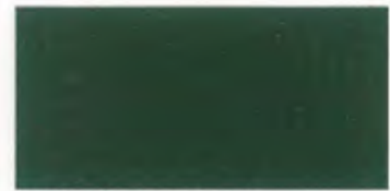
U-06 ダークグリーン [透光率 0.0%]