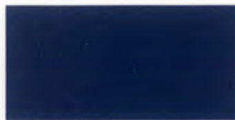
U-32 ネイビー [透光率 0.0%]