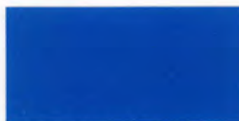
U-01 ロイヤルブルー [透光率 0.0%]