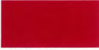
U-30 ワインレッド [透光率 0.4%]