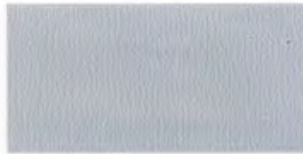
U-21 シルバー [透光率 0.0%]