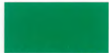
U-07 グリーン [透光率 0.0%]