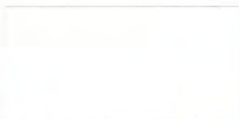
U-18 ホワイト [透光率 9.5%]