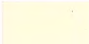
C-17 アイボリー [透光率 7.6%]