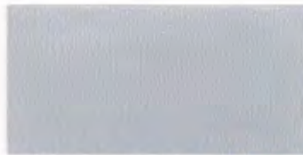
U-22 ホワイトシルバー [透光率 0.2%]