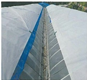
協力:新島ブルーベリーハウス様 http://ashitabahouse.jp/